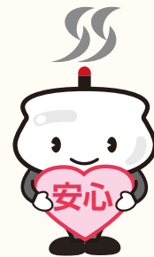
さいたまそうぎ社連盟 キャラクター2代目香炉君